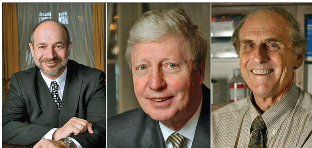
Tabloul laureaților Premiului Nobel pentru Medicină 2011: Bruce Beutler, Jules Hoffmann și Ralph Steinman

Nu doar că am repetat experiența unică de a vi-i aduce aproape, prin materiale în exclusivitate, pe cei mai importanți oameni ai momentului din medicina mondială. Dar an de an am crescut nivelul, reușind, anul trecut, chiar performanța de a-l avea alături, la evenimentul „Nobel în România“, pe profesorul german Harald zur Hausen. Acesta a fost laureat al Premiului Nobel în anul 2008, pentru descoperirea relației de cauzalitate dintre HPV și cancerul de col uterin. A trecut un an de la „Nobel în România“, dar deopotrivă