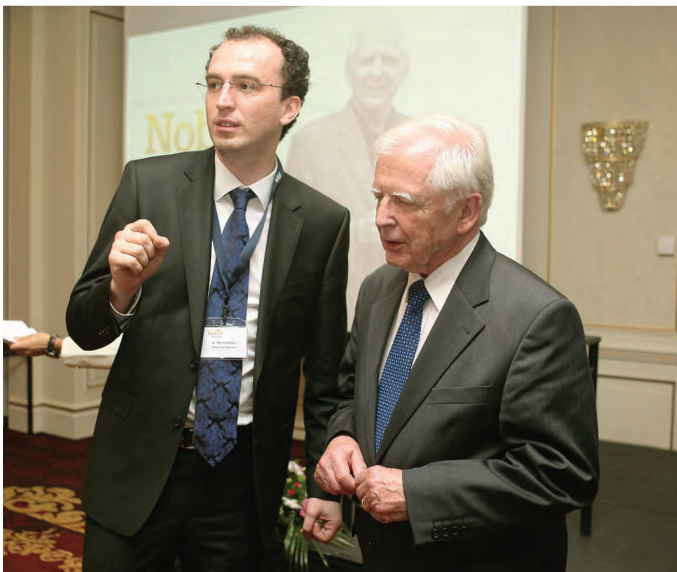
Nobel în România 2010. Alături de Prof. Dr. Harald zur Hausen

parcă evenimentul ar fi avut loc ieri sau, la fel de bine, în urmă cu 100 de ani. Impresiile sunt încă atât de puternice încât sparg barierele percepției timpului și spațiului. Cum am spus și cu acel prilej, a fost pentru prima dată când elita medicală românească a luat o formă concretă. Dincolo de invidii, jocuri individuale și răutăți gratuite. Niciodată nu s-au strâns la un loc atâția oameni importanți din medicina noastră, exceptând forurile academice. Ceea ce este cu atât mai onorant pentru noi, cei de la Revista Hipocrate, care am reușit să coagulăm în jurul unei idei simple atâția oameni importanți. Dacă are o forță, publicația pe care o citiți acum are forța gândului bun al fiecăruia dintre Dumneavoastră.