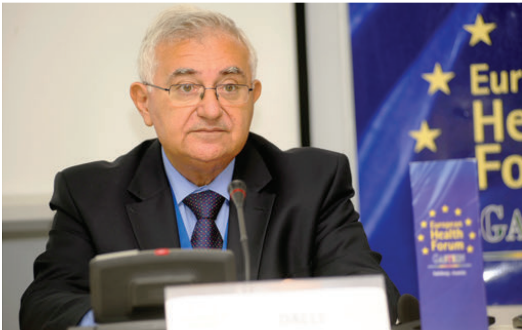
John Dalli, un comisar pentru sănătatea noastră