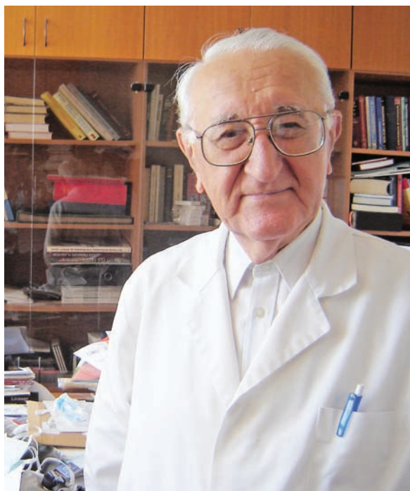
Profesorul Leonida Gherasim, autentic mentor al unor generații de elită din cardiologia românească