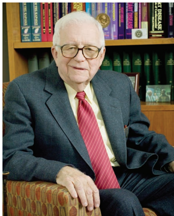
Profesorul Eugene Braunwald, patriarhul cardiologiei moderne